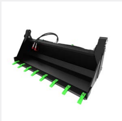
Seau 4 en 1