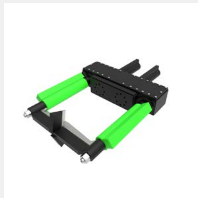
Fendeuse de bûches