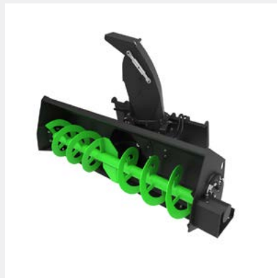
Souffleuse à neige