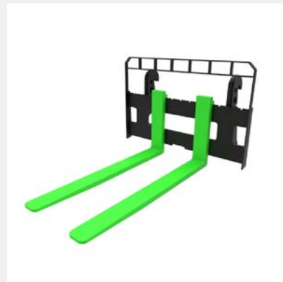
Fourches à palettes